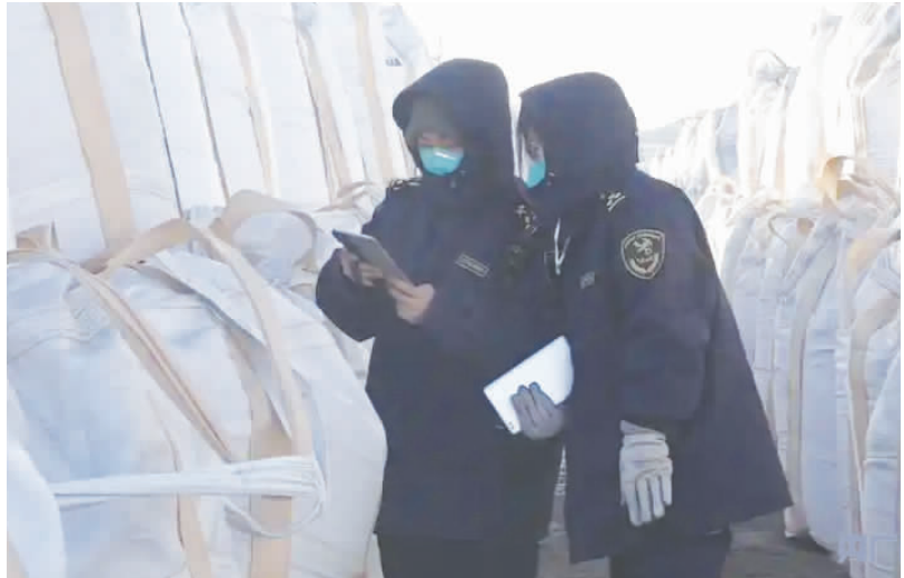
乌拉特海关工作人员采集进境矿产品样品

在内蒙古巴彦淖尔市乌拉特中旗甘其毛都口岸,呈现一派繁忙景象:在重载公路上,双挂集卡车满载进口煤炭、铜精粉等货物,通过智能卡口快速通关;跨境AGV运输车沿专用通道往返运行,与各类货车共同构成了“货”力全开、外贸火热的生动场景。