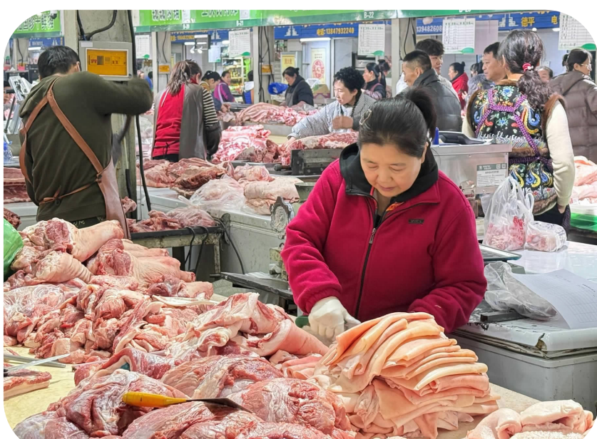
肉摊摊主为顾客切割肉品

临近春节,兴安盟乌兰浩特市各大市场、超市迎来年货采购高峰,琳琅满目的商品、熙熙攘攘的人群、此起彼伏的吆喝声,交织成一幅热闹红火的新春图景,处处涌动着浓浓的年味儿与市井烟火气,承载着市民对新年的美好期盼。