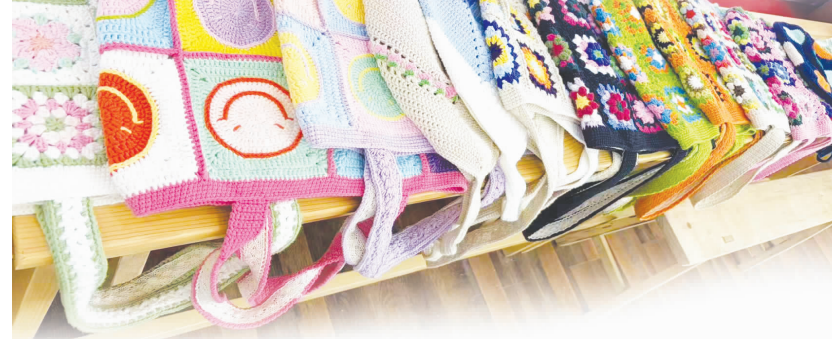
林西镇家门口就业服务站里的手工编织作品

本报讯(记者 张鑫)毛线翻织就增收源泉,巧手匠心绽放巾帼风采。近日,在赤峰市林西县林西镇家门口就业服务站里,一场接地气、实用性强的手工编织技能培训火热开展,辖区留守妇女、待业妇女围坐一堂,跟着专业老师专心学艺,一根根普通的毛线在指尖穿梭,化作精致的编织作品,也编织起她们居家就业、稳定增收的幸福梦想。