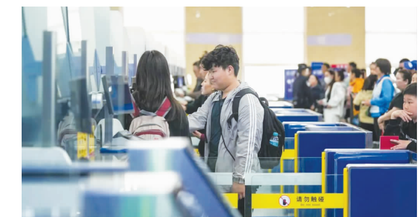
二连出入境边防检查站移民管理警察有序为旅客办理通关手续

据二连出入境边防检查站统计,截至5月14日,二连口岸验放出入境人员突破100万人次,同比增长4.17%。较去年提前4天突破百万人次,再创历史新高。