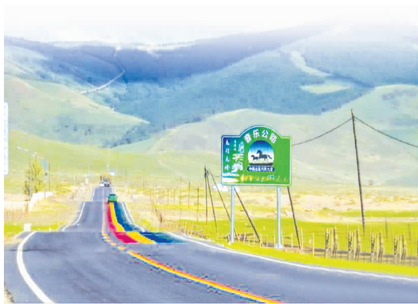
赤峰市首条音乐公路在克什克腾旗达达线建成投用

近日,内蒙古赤峰市首条音乐公路在克什克腾旗达达线建成投用。这条公路依托草原独特风光,将本土音乐文化、自驾游体验与道路交通功能融合,培育“交通+文旅”融合新业态,进一步丰富全域旅游产品供给。