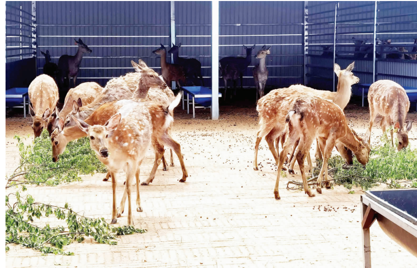
万顺鹿场内,梅花鹿正悠闲进食

呦呦鹿鸣,生机满乡野。呼伦贝尔市阿荣旗查巴奇鄂温克族乡民族村深挖闲置资源,携手万顺鹿场走村企联建之路,靠梅花鹿特色产业盘活资产、鼓起村民腰包,为乡村振兴添足动力。