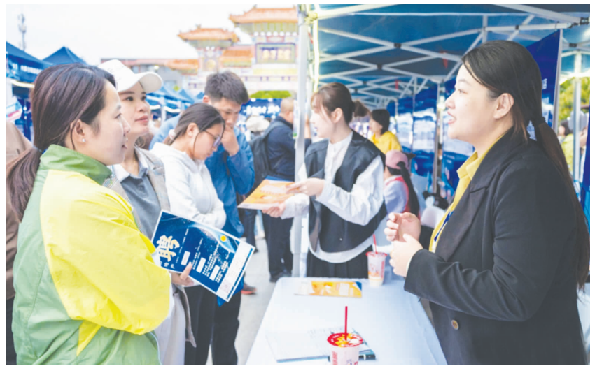
求职者与招聘人员在洽谈

6月5日晚,呼和浩特市高校毕业生系列巡回招聘活动现场人头攒动。当日,“青聚英才·职为你来”呼和浩特市2026年高校毕业生系列巡回招聘活动走进玉泉区塞上老街旅游休闲街区,标志着呼和浩特市年度夜市巡回招聘活动启动。