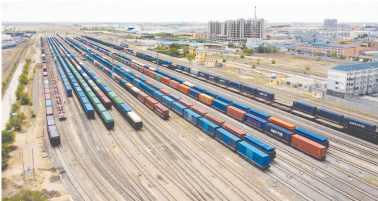
中欧班列在二连浩特铁路口岸集结待发